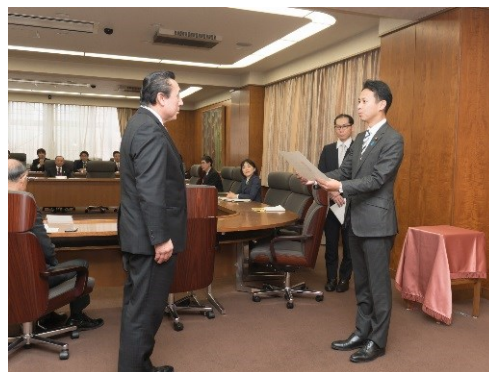
左：農林水産副大臣 谷合 正明氏