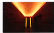
ジェームズ・ツレル「光の館」