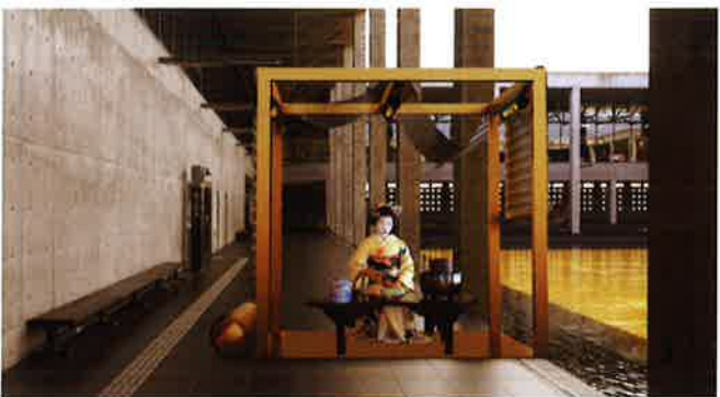
ドミニク・ペロー 作品イメージ

4/28(土)～6/3(日)10:00～17:00 (水休、5/2(水)は開館) 大地の芸術祭2018の企画展「2018年の<方丈記私記>」展の準備が始まります。約30点の出品作品模型や、実物大の方丈を体験できるブースなどで、ユニークな空間が立ち上がるプロセスをご覧ください。