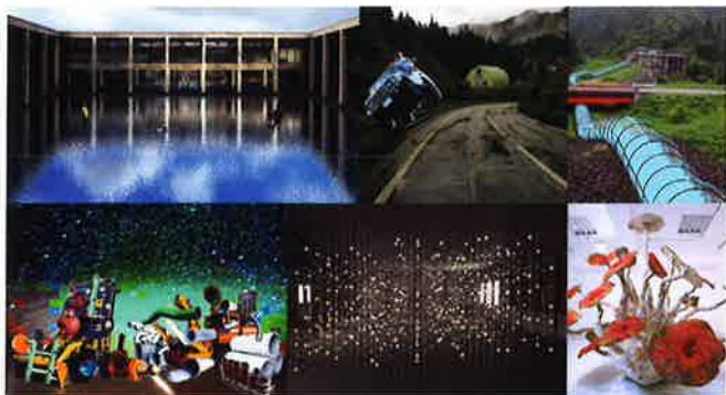
(左上より)レアンドロ・エルリッヒ、作品イメージ/アーメット・オーグット、作品イメージ/磯辺行久、作品イメージ/金氏徹平、作品イメージ/ダミアン・オルテガ、作品イメージ/「空想×体験」里山のミクロとマクロのいこものラボ、作品イメージ

4/28(土)～6/24(日)10:00～17:00 (水休、5/2(水)は開館) 入場無料 改修工事を終え、リニューアルオープンするまつだい「農舞台」。「大地の芸術祭 LIVEセンター」を設置し、参加作家のプランや制作状況など、芸術祭の準備プロセスを公開します。「大地の芸術祭」ができるまでの過程を体感できる新たな試みです。