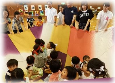
◆なかよし大運動会◆