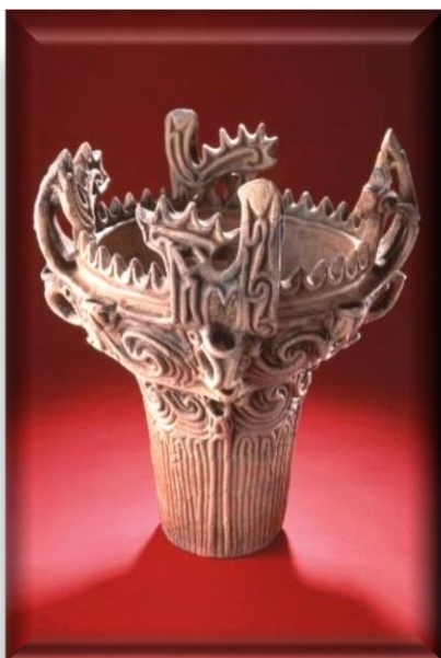
「国宝の火焰型土器」