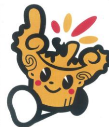
十日町市博物館キャラクター「ほのおまる」