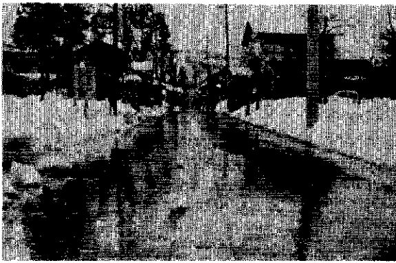
(水需要は増加の一途)