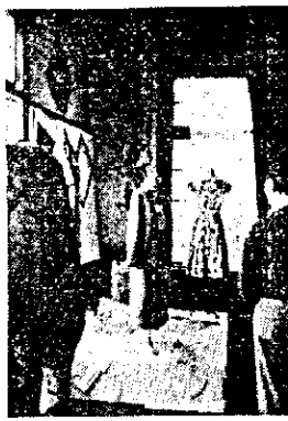
↑ 高校生徒作品衣料展

小中学校並に本校の児童生徒作品展は新校舎九教室に演劇、書道、家庭科、手芸展と会場一バイに催されました。