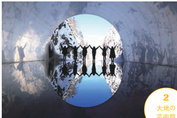
マ・ヤンソン/MADアーキテクト「Tunnel of Light」