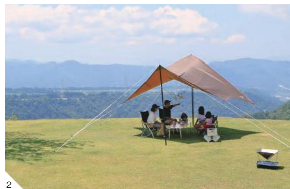
1: 存分に自然を感じて遊べる アウトドアフィールド 「大蔵寺高原キャンプ場」 2: 景色良好・開放感抜群の 「清田山キャンプ場」

した。特に最後の見晴所であるパノラマステーション（上写真）は、清津峡の清らかな雪解け水が張られた水面に四季折々の柱状節理の景色が映り込む、幻想的な空間です。作品を設計した、MAD建築事務所を共同主宰する早野洋介さんは「このプロジェクトが、清津峡の美しさを世界中に広めるきっかけとなれたことをうれしく思います。十日町市の食や文化など、さまざまな魅力発信の基点となってほしいです」と、今後の期待を話してくれました。