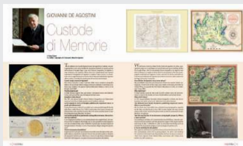
GMDA©2022 Associazione Italgeo-Imago Mundi