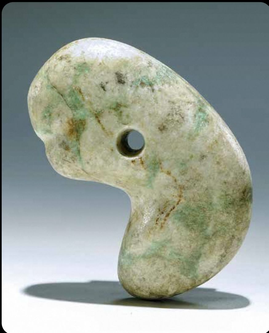
長者原A遺跡勾玉(当館蔵)

令和4年11月4日にヒスイが「新潟県の石」に指定されました。縄文時代を中心に新潟県内の遺跡から出土したヒスイ製装飾品やヒスイ原石標本約100点を一堂に集め新潟県の新たなシンボル・ヒスイの魅力に迫ります。