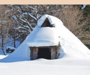
冬の竖穴住居 (笹山遺跡)