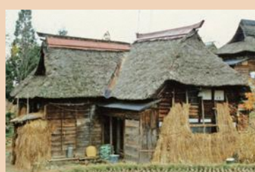
農家の雪囲い (昭和40年代)