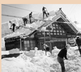
街中の雪下ろし (昭和30年代)