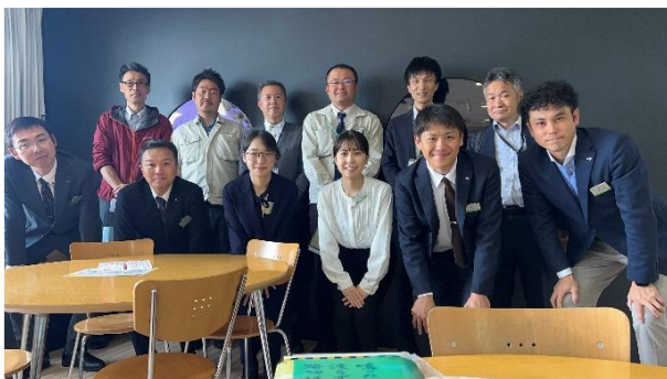
十日町市文化観光課との意見交換(2026 年)