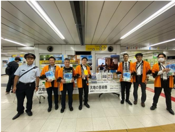
新宿駅での PR(2024 年)