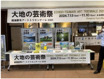
大地の芸術祭 PR ブース(2024 年)