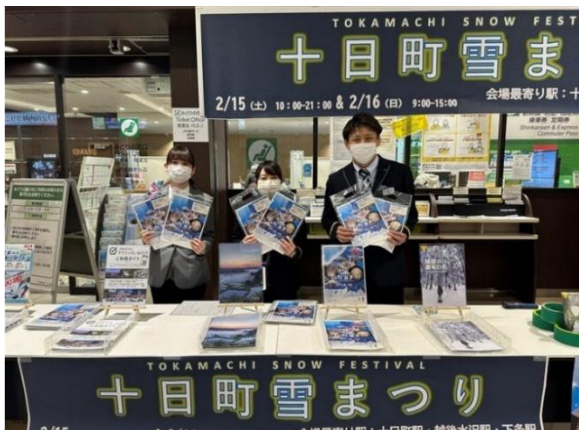
十日町雪まつりの PR(2024 年)