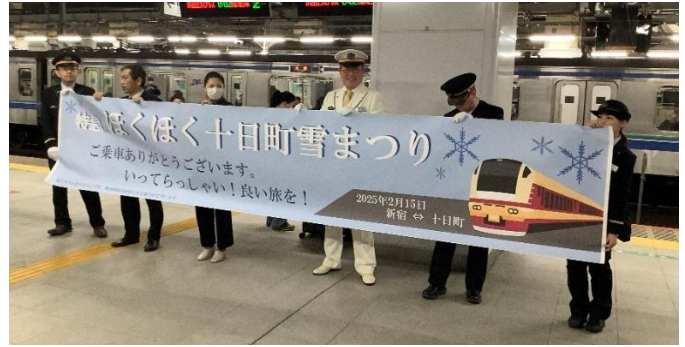
新宿駅「ほくほく十日町雪まつり号」お見送り(2025 年)