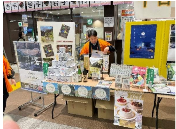
十日町ふるさと納税の PR(2025 年)