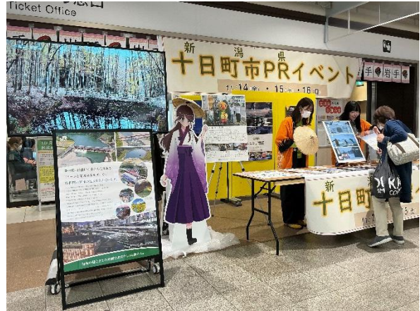
実践女子大学学生のブース(2026 年)