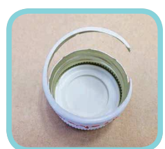
ドリンクびんキャップ