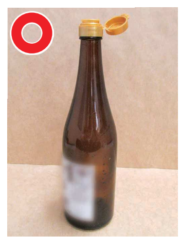
軽く洗い、このまま出してください。