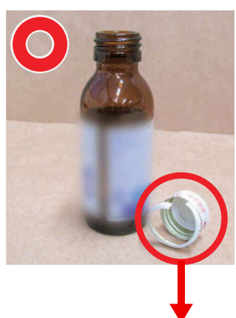
キャップは埋立てごみに出してください。