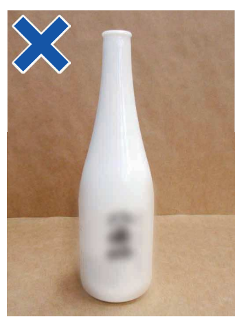
白色びんは、リサイクルできません。埋立てごみに出してください。