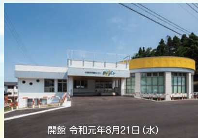
開館 令和元年8月21日（水）