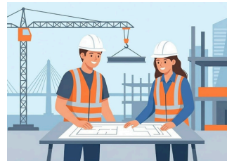
建設・インフラ コース