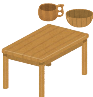
事務所・店舗の備品