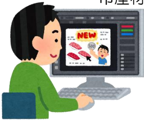
広告・宣伝等の費用