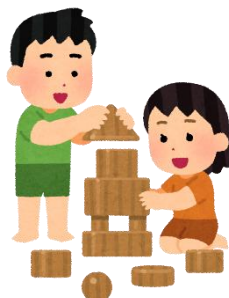
保育施設のおもちゃ