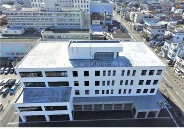
十日町市医療福祉総合センター