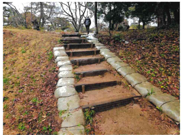
遊歩道(潮騒はまなす公園)