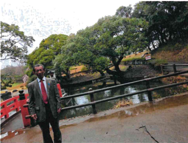
潮騒はまなす公園