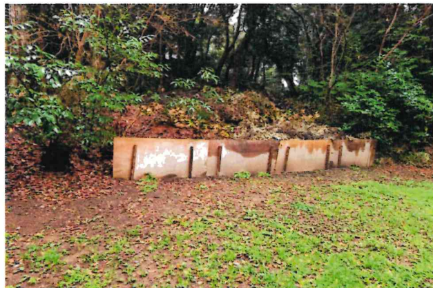
枯枝や落葉の堆積場所(潮騒はまなす公園)