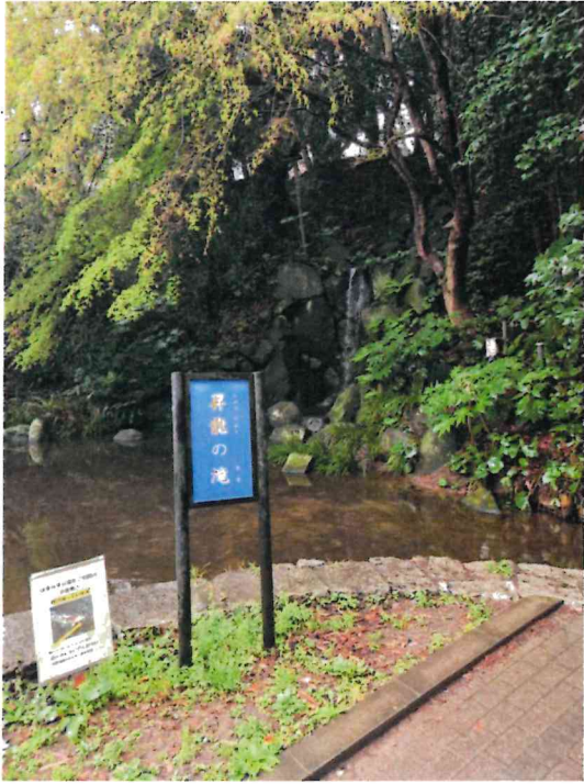
昇龍の滝(潮騒はまなす公園)