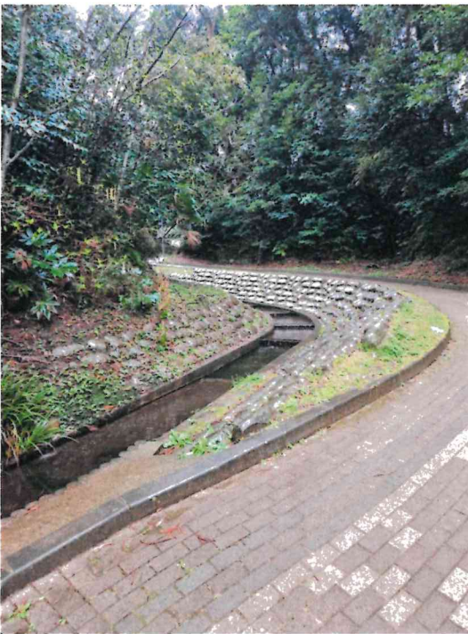
水路と遊歩道(潮騒はまなす公園)