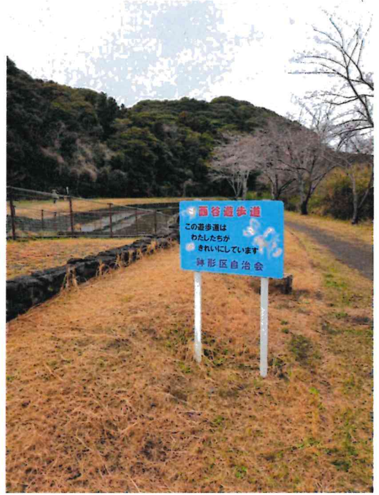
遊歩道(潮騒はまなす公園)