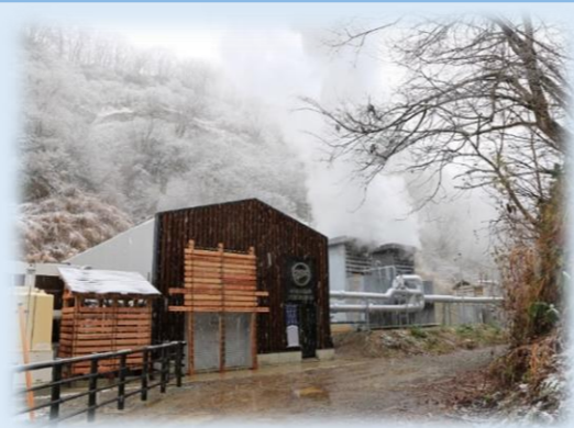
松之山温泉地熱バイナリー発電所