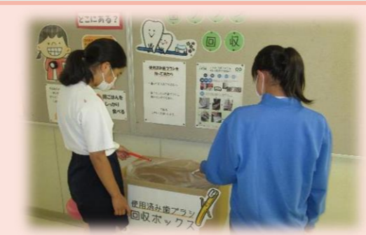
中学校での使用済み歯ブラシ回収