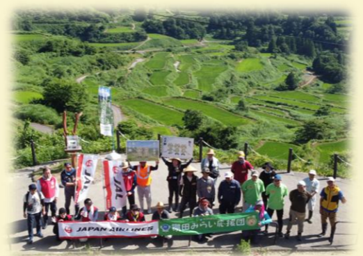
棚田みらい応援団の取り組み