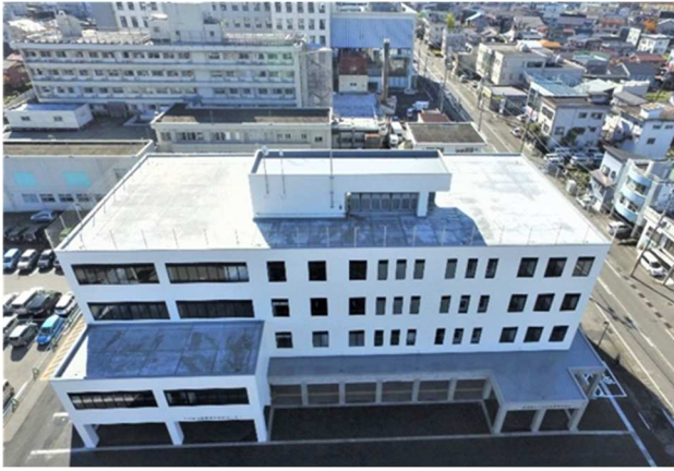
十日町市医療福祉総合センター