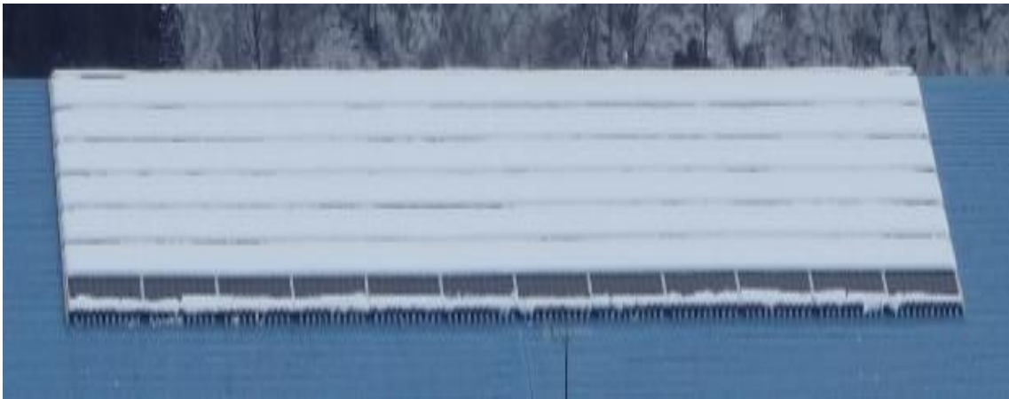
積雪のあるパネル

降雪時に太陽光パネルに積雪があると、発電を行わなくなるため、なるべく積雪しないように設置する必要があります。積雪する原因の1つとして、パネルの取付金具への着雪が挙げられます。