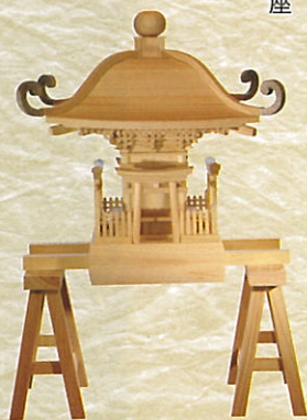
松苧神社神輿(模型)

入母屋(いりもや) 檼造り農家を利用したノスタルジックな郷土資料館。市内池尻からこの場所に解体・移築しました。