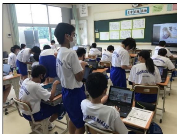
学習用端末を活用した授業風景 (千手小学校(左)、中条中学校(右))

令和3年度の後半からは学習用端末を活用した本格的なICT授業を実施しました。コロナ禍による学級閉鎖で登校できない児童生徒には、家庭での健康観察やオンライン授業を行いました。また、市でモバイルWi-Fiルーターを50台用意し、通信環境が整っていない家庭への貸し出しも行っています。