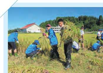
ふるさと体験(畑作・稲作)