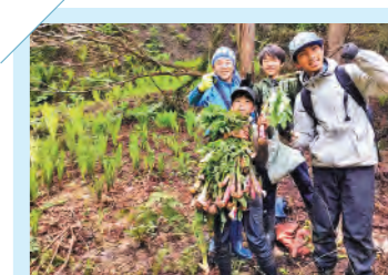
ふるさと体験(山菜とり)