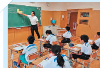
中学校教師による乗り入れ授業(算数)