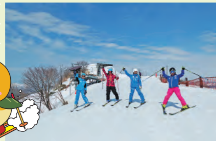
松之山温泉スキー場