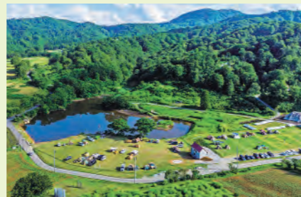
大蔵寺高原キャンプ場