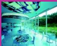
「カフェ・ルフレ」ジャン・リュック・ウィルムード作。越後まつたい里山食堂は、作品でもあります。