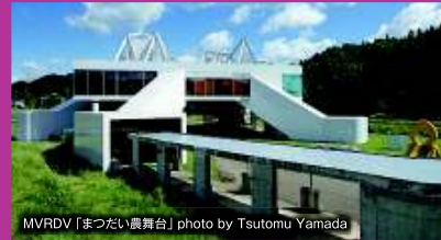
MVRDV「まつたい震舞台」