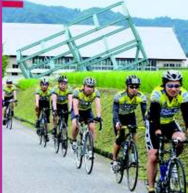
「ツールド妻有2009」

大地の芸術祭越後妻有アートトリエンナーレ (Echigo-Tsumari Art Triennale) は、越後妻有地域十日町市・津南町で開催される世界最大規模の国際芸術祭。人間は自然に内包されるを理念に、約760平方キロメートルの広大な土地を舞台に、地域に内在するさまざまな価値をアートを媒介として掘り起こし、その魅力を高め、世界に発信し、地域再生の道筋を築いていくことを目指しています。2000年のスタート以来、2003年、2006年、2009年の4回が開催され好評を博し、現在2012年の第5回展に向けた準備が進められています。また、大地の芸術祭開催後に地域の資源として残った作品も数多く、トリエンナーレ開催期間以外にも四季折々の里山の自然とアートが楽しめる「大地の芸術祭の里」として来訪者をお迎えしています。