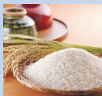
魚沼産コシヒカリ (2.25キログラム)