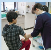
子どもの医療費を18歳まで助成しています