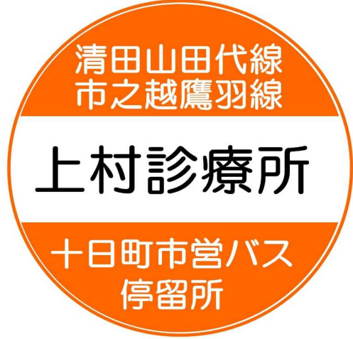
バス停留所看板イメージ図