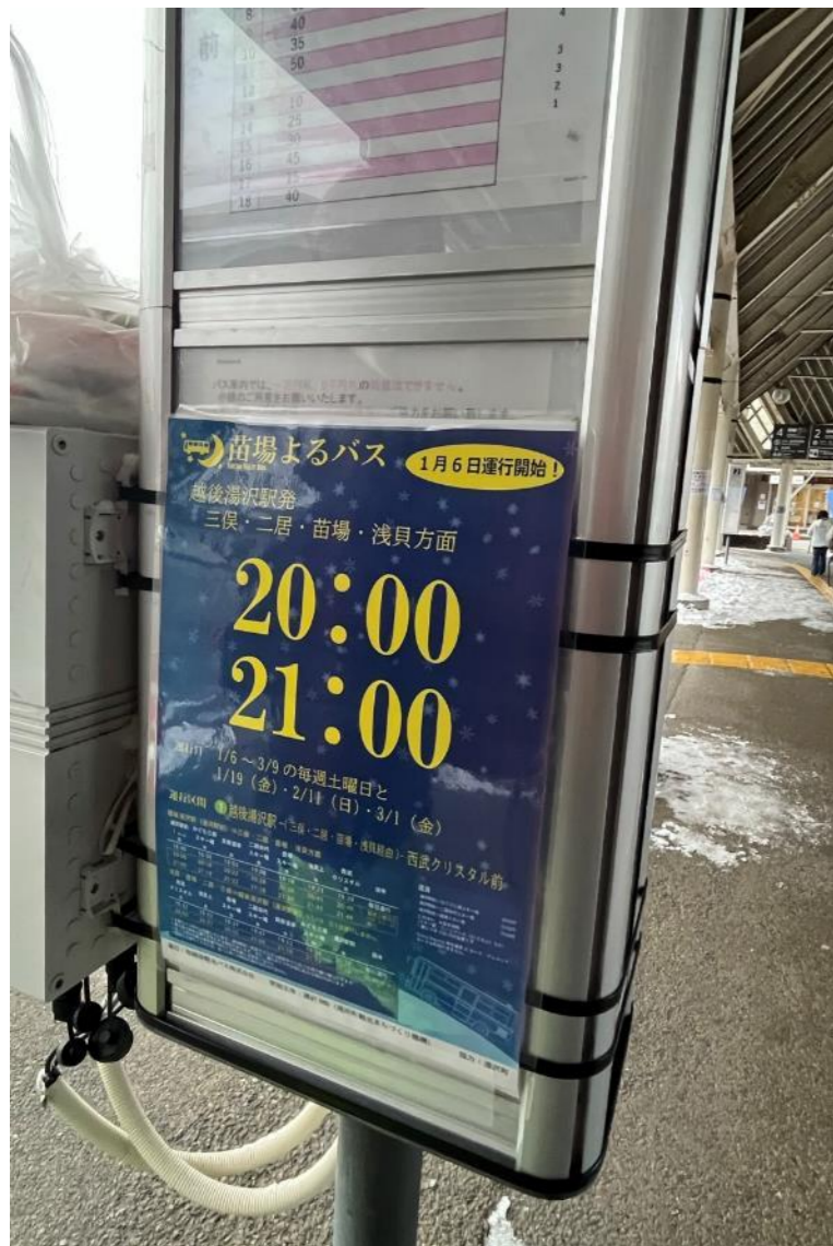
↑バス停広告イメージ