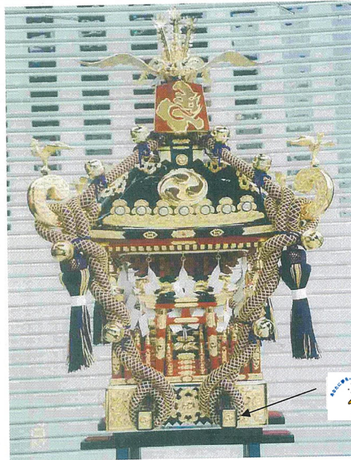
① 延屋根型塗神輿 1尺3寸吹返し、瓔珞無し