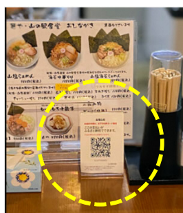
飲食店での設置例