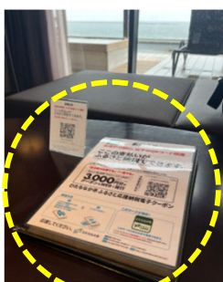
受付等での設置例

利用者に「ここで、ふるさと納税を申し込める」と気付いてもらうための販促物を弊社でご用意します。 お客様の目につきやすい箇所へ販促物の設置をお願いします。