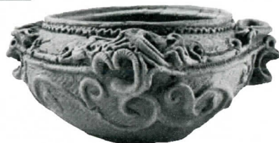
東北系の大木8a式土器

会 場：日黒邸資料館(魚沼市須原) 日 時：5月26日(土)～7/16(月) 9:00～16:00 観 覧：大人200円(150円)、小・中学生100円(60円) ※( )は20人以上の団体料金