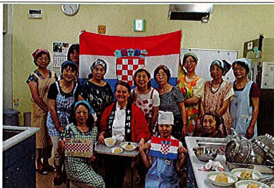
H29.7.12 に行った「料理講習会（一般）」の様子