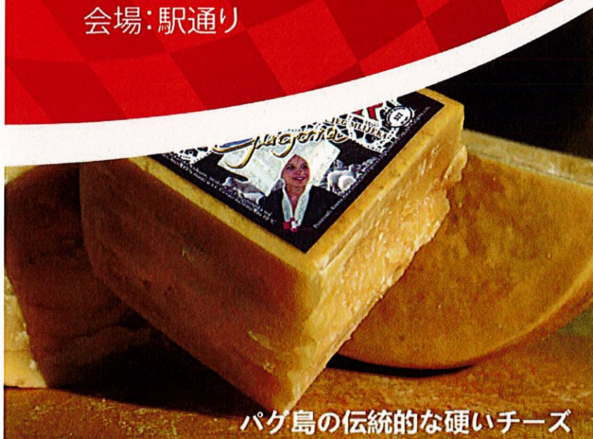
パグ島の伝統的な硬いチーズ