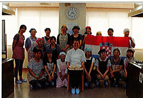
H29.7.11 に行った「料理講習会（給食調理員等）」の様子