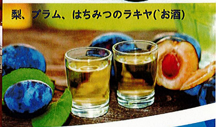
梨、プラム、はちみつのお酒