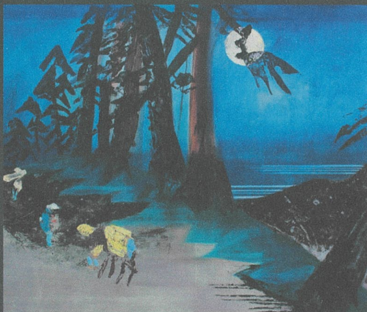
歌川広重へ捧ぐ, 油絵・キャンバス, 120 x 180 cm, 2013年