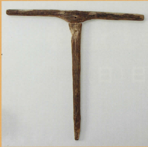
長野県 榎田遺跡 杵 -古墳時代中期- (長野県立歴史館所蔵)