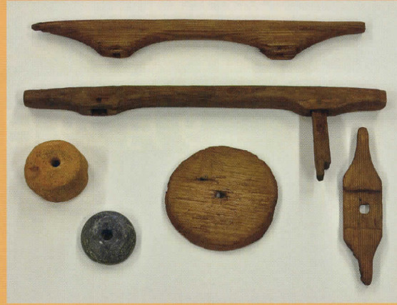
新潟県 八幡林遺跡 糸杵・紡錘車 -奈良・平安時代- (長岡市教育委員会所蔵)