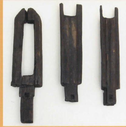
山梨県 平田宮第2遺跡 中筒受け・招木受け -平安時代- (中央市教育委員会所蔵)