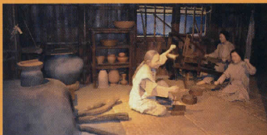
馬場上ムラの暮らし -奈良時代- (当館 考古展示室)