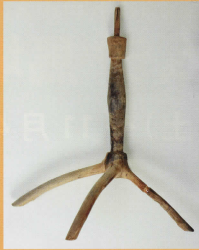
長野県 榎田遺跡 認めかけ -古墳時代中期- (長野県立歴史館所蔵)