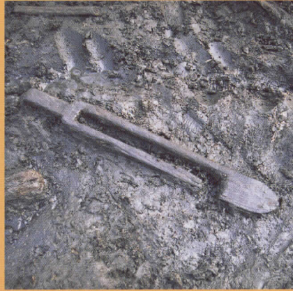
埼玉県 池守遺跡 中筒受け出土状況 -古墳時代後期-