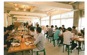
TSUMARI KITCHEN @奴奈川キャンパス ・週末のみ営業 11:00-16:00 (L.O.15:30) ※レストランのみのご利用は入館無料