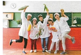
越後妻有「上郷クローブ座」レストラン ・10/6、7、8 限定 12:00-12:50 (要予約/40席) ※レストランのみのご利用は入館無料