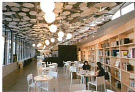
越後まつのがわバル 10:00-17:00 (L.O.16:30、ランチ 11:30-14:00) ※営業日はキナーレと同じ