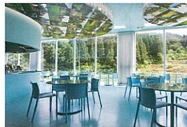
越後まつだい里山食堂 10:00-17:00 (L.O.16:30、ランチ 11:00-14:00) ※営業日は農舞台と同じ