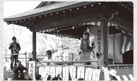
上山川諏訪神社太々神楽

会場：柏崎市文化会館アルフォーレ (新潟県柏崎市日石町4-32 TEL.0257-21-0010)