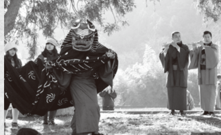
下市之瀬の獅子舞