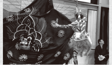
日和山神社鬼獅子