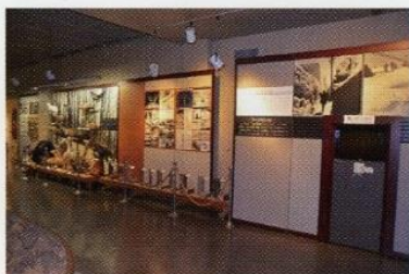
大河・信濃川—川の魚と川漁—