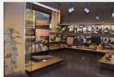
越後縮のできるまで