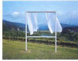
内海昭子 「たくさん失われた窓のために」

10/12 土 ・13 日 ・14 月・祝 ・ 19 土 ・20 日 ・26 土 ・27 日 ・ 11/2 土 ・3 日・祝 ・4 月・振休 10:00~17:00 (施設、作品によって異なる) 越後妻有里山現代美術館 [キナーレ] ほか 十日町市本町六の一丁目71-26 ほか