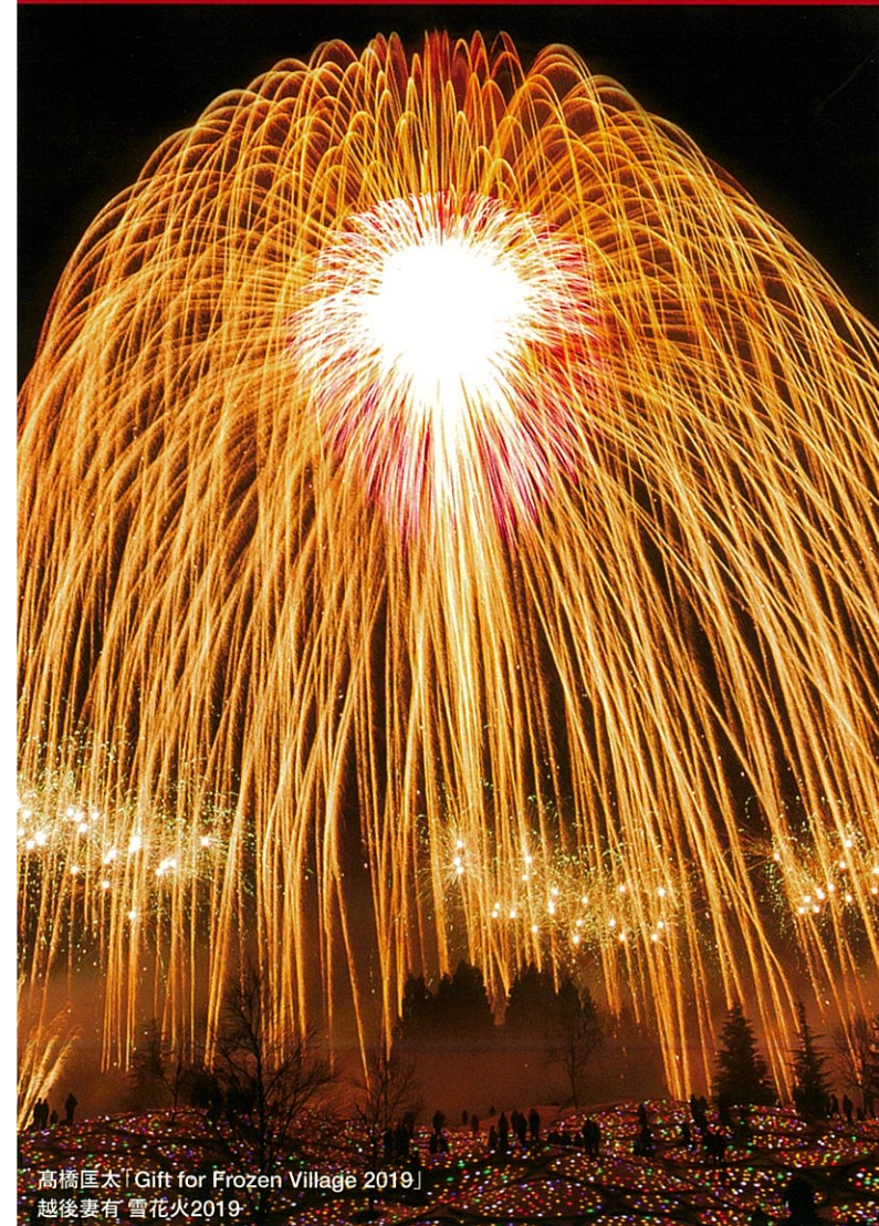
高橋匡太「Gift for Frozen Village 2019」 越後妻有 雪花火2019