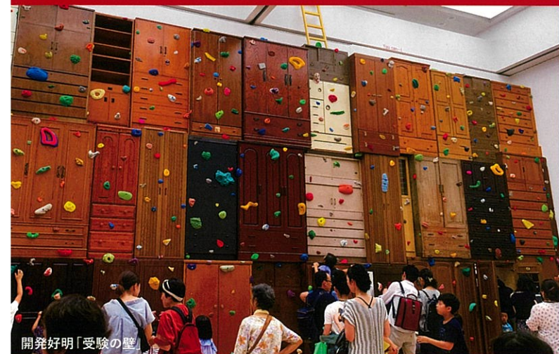
開発好明「受験の壁」