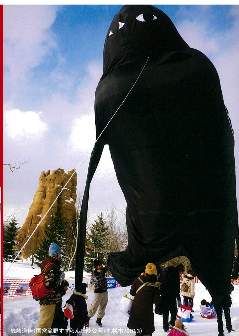
磯崎道佳「国営流野すらん丘陵公園/札幌市/2013」