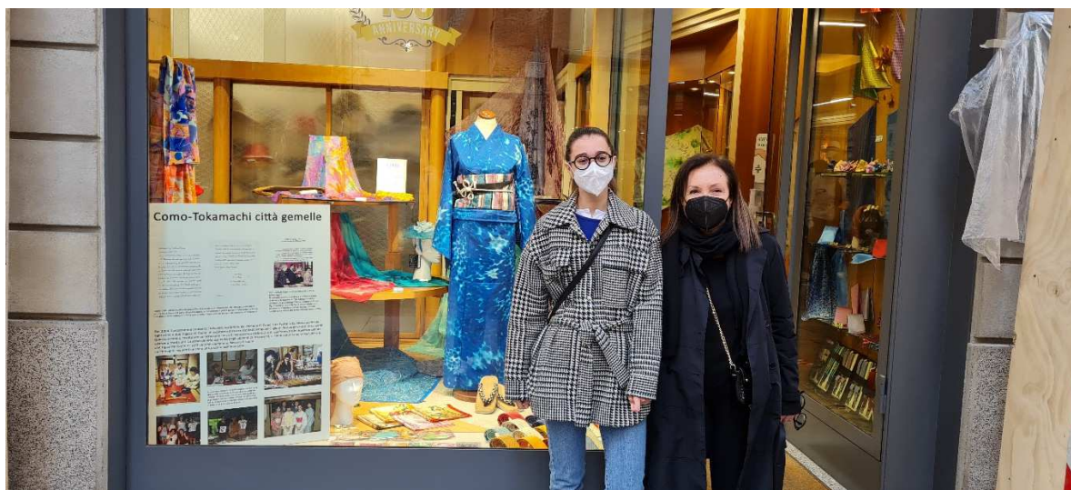
地図番号⑫ 「ピッチ」(老舗シルクストア)の様子