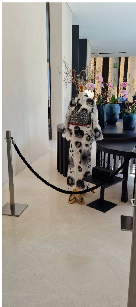
地図番号① 「ホテルヒルトン」の様子