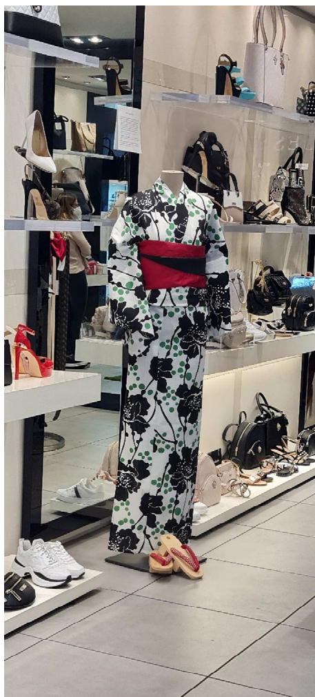
地図番号⑬ 「ゲス フォットウエア」の様子