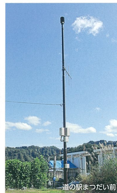
道の駅まつだい前

市役所からの放送を受信する装置です。屋外スピーカーにて放送します。停電時には内蔵されている蓄電池で作動します。