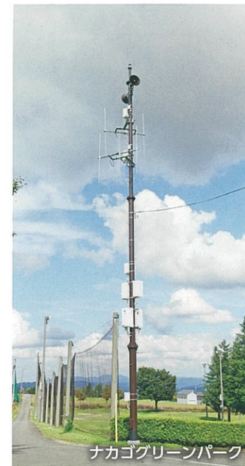
ナカゴグリーンパーク