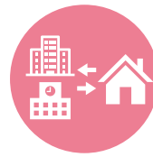
関係機関と 連携した支援