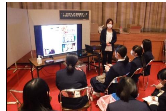
「まちの産業発見塾」の様子