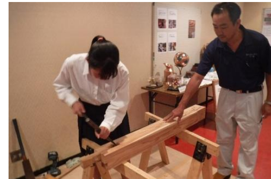
「まちの産業発見塾」の様子