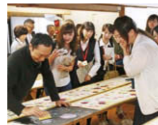
間近で見る職人技に感動

「十日町きもの月間2018」のイベントの1つで、工場できものづくりが見学できる「～職人探訪～十日町きものGOTTAKU」が行われました。全国初の取組みであり、17日～19日の3日間、開放された市内の13工場を約750人が見学しました。