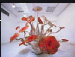
「森の学校」キヨロロ / 「空想×体験! 里山のミクロとマクロのいきものラボ」

動物や伝承の生き物をモチーフにした作品群や、作家と一緒に作るワークショップなど、家族でアートに触れ合えます。