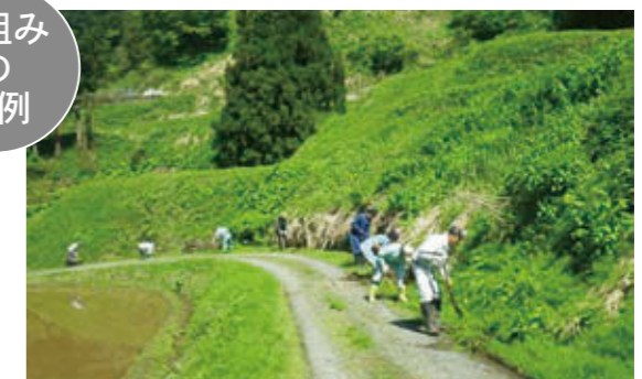
水路・側溝の泥上げ(堀之内集落協定)