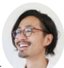
地域おこし協力隊 水沢地区担当