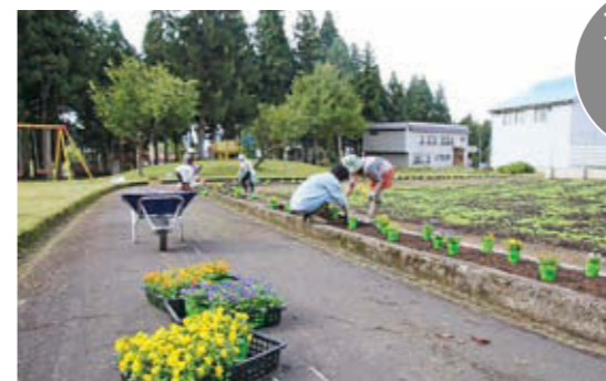
景観植物の植栽(上之島集落協定)