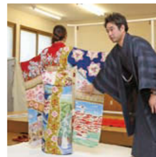
お披露目されたクロアチア共和国のきもの

「十日町きもの月間2018」のイベントの1つで、工場できものづくりが見学できる「～職人探訪～十日町きものGOTTAKU」が行われました。全国初の取組みであり、17日～19日の3日間、開放された市内の13工場を約750人が見学しました。