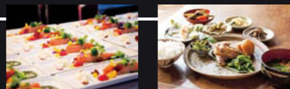
左: 奴奈川キャンパス/米澤文雄シェフ監修(オフィシャルツアー限定) 右: うぶすなの家

ミシュラン星付レストランのシェフが監修するツアー限定スペシャルランチ、地元女衆がもてなす古民家アート兼レストラン、廃校を舞台にした芝居風レストランなど、アートと食を楽しめるスポットが盛りだくさんです。