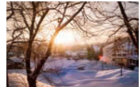
こへび活動が始まる早朝の、白い霧から昇る太陽。これからどんな素敵なことが起こるのか、期待が膨らみます。

出会いとアートに刺激を受けながら 知り合いの紹介でこへび隊に参加し、今年で2年目になります。就職活動に苦しむなか、都会から離れたところで身体を動かしリフレッシュしたいと思っていたとき、こへび隊活動と出会いました。 こへび隊の魅力は、地域に貢献しながらアートに触れることができることだと思います。草むしりをしたり、重い荷物を運んだり、まさに美術館の中にスポーツジムがあるような感覚で、普通の旅行では得られない体験ができます。札幌に住んでいたこともありますが、積雪地域で暮らす皆さんは越後妻有でも札幌でも心の温かい人たちが多く、こちらまで笑顔になります。ここに暮らす皆さんの優しさが、大地の芸術祭を通して広まることを願っています。 ■ 問合せ＝観光交流課芸術祭企画係 ☎757-2637