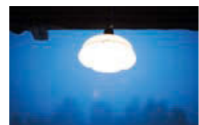
雪の中を照らす暖かい光が、一日の終わりを優しく告げてくれます。