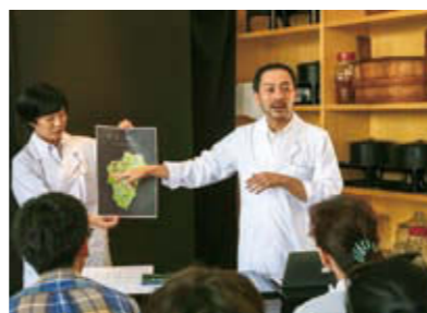
芸術祭会期中、越後妻有里山現代美術館【キナーレ】で毎日開催