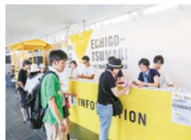
芸術祭会期中、案内所などをぜひ利用してください