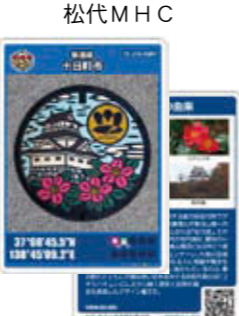
松代MHC 松代・松之山温泉観光案内所で配布中