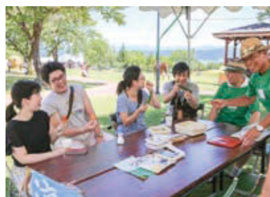
さまざまな「おもてなし」に、笑みがこぼれます

を見たあの場所のお米は、こんな味なのか」ということを思い出して、作品とお米の味をつなげてもらうと、地域のことを別の視点で知ることができるきっかけとなるのではないかと考え、「ザ おこめショー」を行います。地元の方の皆さんの参加もお待ちしております。