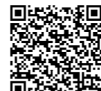
フェイスブック QRコード