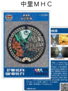
中里MHC 清津峡溪谷とユリがデザイン

清津峡溪谷トンネル 管理事務所(小出) ● 配布時期など = 4月〜9月の午前8時30分〜午後4時30分 ミオンなかさと(宮中) ● 配布時期など = 10月〜3月の午前10時〜午後10時 ※休館日の(木)はゆくら妻有(芋川)で配布