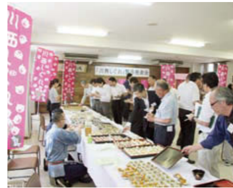
発表会ではさまざまなメニューの試食も

井ものや寿司など、ご飯に合わせることはもちろん、サラダ、うどん、そば、一品料理やお惣菜など、さまざまなメニュー展開で、川西しぐれはのぼり旗のある川西地域の飲食店で提供されています。地域の人たちが川西のために、川西を思い開発した新たな特産品。ぜひ、一度食べてみませんか。