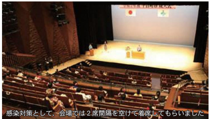
感染対策として、会場では2席間隔を空けて着席してもらいました

3月14日(日)、新型コロナウイルス感染症の影響で延期していた令和2年度成人式を、感染予防対策を徹底して、越後妻有文化ホール「段十ろう」で開催しました。今回の該当成人は536人。うち、157人が会場へ直接参加したほか、感染予防などのために会場参加を見合わせた41人が、オンラインで参加しました。