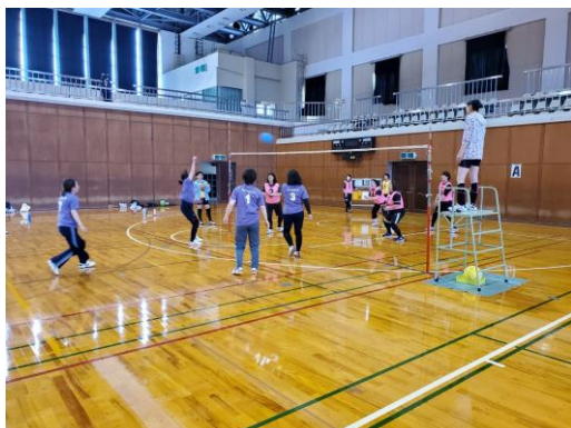
ソフトバレーボール大会

※１ クロアチアホストタウン推進事業プロジェクトチームおよびクロアチア共和国選手団十日町市事前キャンプ推進委員会は、令和４年３月に解散しました。