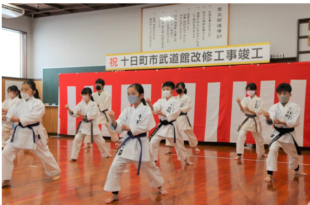
十日町市武道館改修工事竣工式（令和5年1月4日）