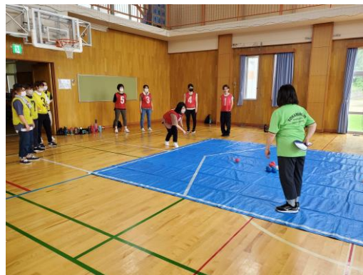
スポーツ推進委員による出前指導講座 (ボッチャ)