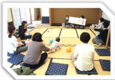
◆リズム遊び・手遊び◆