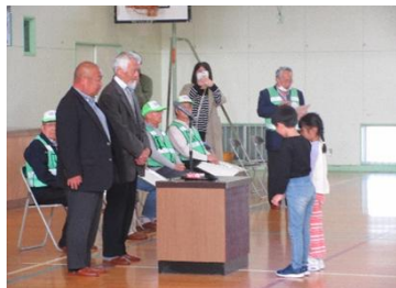
南地域防犯連絡協議会 十日町警察署

全国的に子どもが犯罪に巻き込まれる事案が後を絶たないことから、犯罪の防止や軽減する事を目的として十日町南地域自治振興会と南地域防犯連絡協議会が4月17日(金)に川治小学校体育館で新1年生38名に防犯ブザーを配布しました。