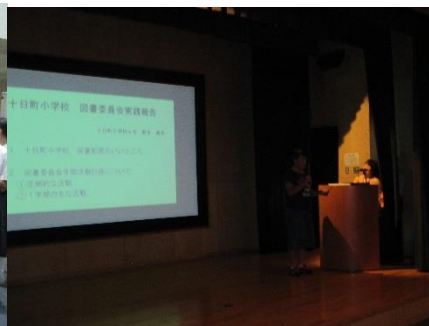
<十日町小学校の発表>