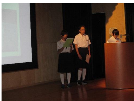
<十日町中学校の発表>