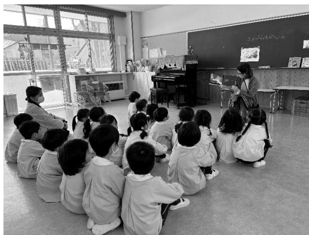
ボランティアによる読み聞かせの様子