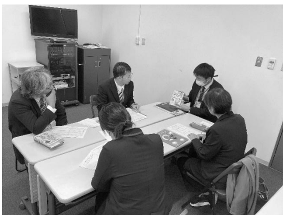
学校図書館担当職員研修の様子