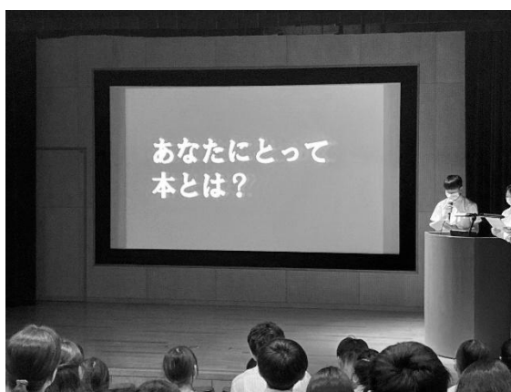
図書委員会サミットの様子