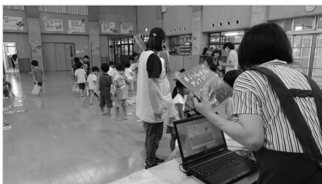
出張貸出（えほんの日）の様子