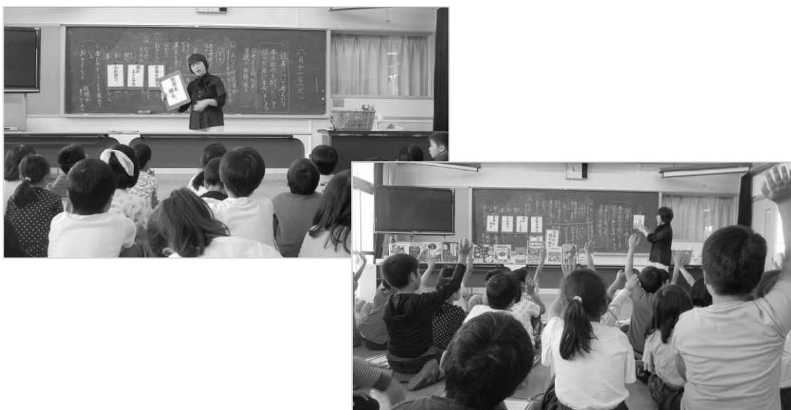
楽しい読書出前授業の様子